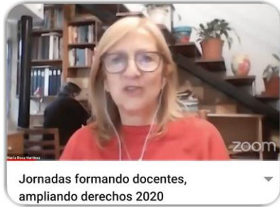
Jornadas formando docentes, ampliando derechos 2020