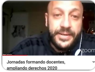
Jornadas formando docentes, ampliando derechos 2020