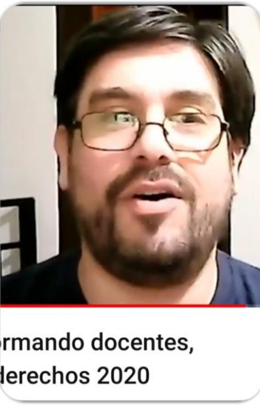
rmando docentes, derechos 2020