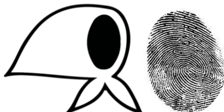
Comisión de Identidad y Memoria del Abuelas

La Comisión de identidad del I.S.F.D. Nº1 nació en mayo de 2019 con la aprobación por parte del C.A.I. de una comisión ad hoc que se encargaría de realizar las señalizaciones y la restauración de las imágenes colocadas con motivo de la inauguración del segundo piso.